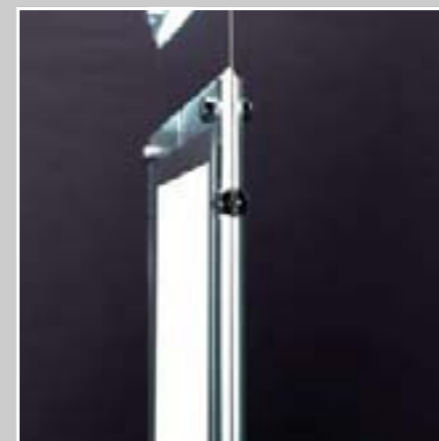
épaisseur 12 mm